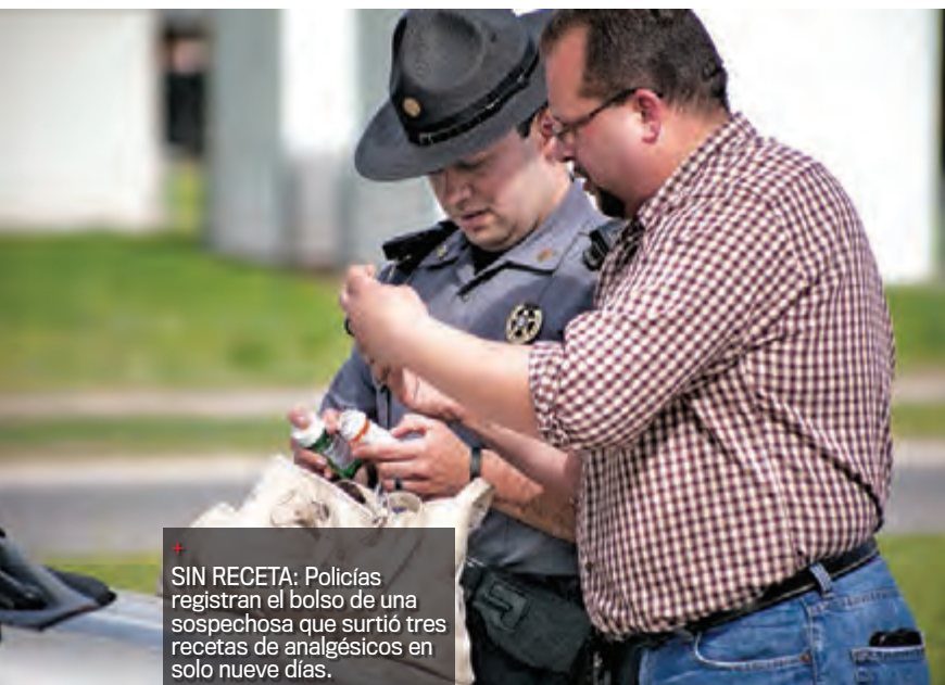
SIN RECETA: Policias registran el bolso de una sospechosa que surtió tres recetas de analgésicos en solo nueve días.

PUBLICADO EN COOPERACIÓN CON NEWSWEEK / PUBLISHED IN COOPERATION WITH NEWSWEEK