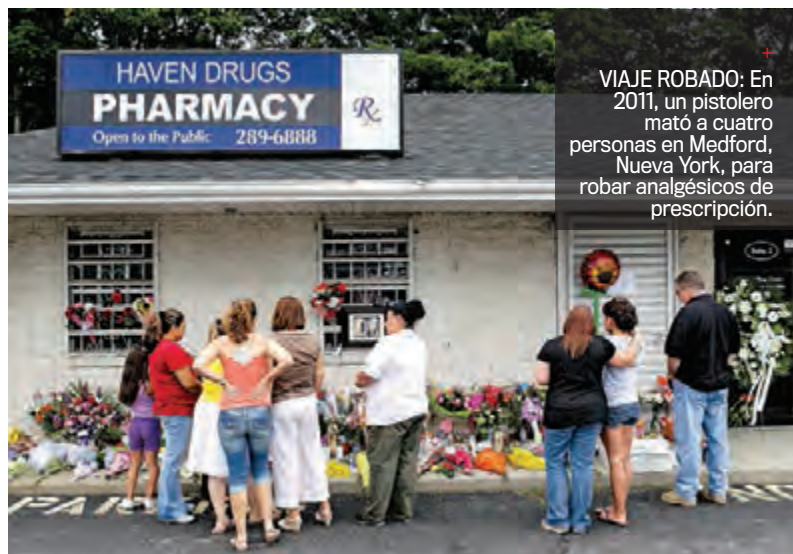
VIAJE ROBADO: En 2011, un pistolero mató a cuatro personas en Medford, Nueva York, para robar analgésicos de prescripción.